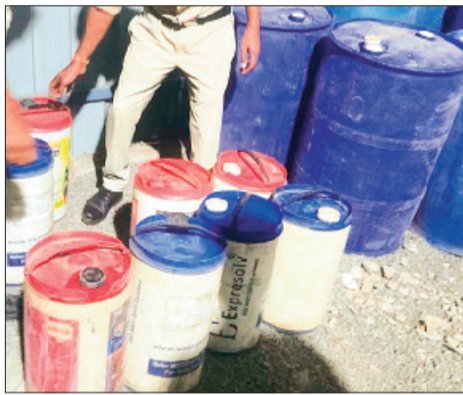
छोटे-बड़े ड्रमों में भरकर रखा गया था। जब्त किए गए डीजल को बाजार में अनुमानित कीमत लगभग 4 लाख रुपये बताई