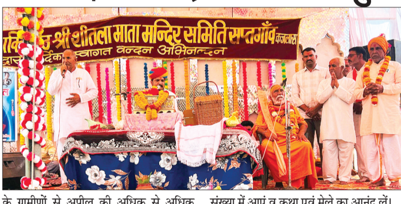
के ग्रामीणों से अपील की अधिक से अधिक संख्या में आएँ व कथा एवं मेले का आनंद लें।