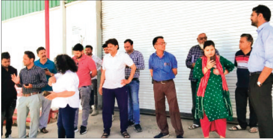
बकाया होने पर प्रतिष्ठानों को सील किया गया।

निगम की सख्ती का असर यह रहा कि तालाबंदी से पहले ही कई कंपनियों ने अपना बकाया कर जमा कर दिया। इसमें सुदर्शन डिकॉन ने 2 लाख, गजरा गियर्स कंपनी ने 7 लाख, एमपी एग्री बीआरके ने 1.30 लाख, गंगोत्री फ्लैक्ट्यूब ने 2 लाख, डीआर होटल ने 3 लाख, अनिक मिल्क ने 75 लाख, विध्याचल स्कूल ने 30 लाख और आनमय स्कूल ने 1.50 लाख रुपए जमा किए। इसके बाद भी जिन बकायादारों ने कर जमा नहीं किया, उनके खिलाफ निगम की टीम ने कुर्की और तालाबंदी की कार्रवाई की। कार्रवाई के दौरान श्री हरि गार्डन (8 लाख), शेख नायता जमात खाना (8 लाख), मिलन रेस्टोरेंट (1 लाख), एमपी रूई भंडार (58 हजार), गायत्री टाइम्स (2.37 लाख), वार्ड 40 में गम्फार (11.05 लाख), शमाबी (58 हजार) और कासम (63 हजार) पर कार्रवाई की जा रही है।