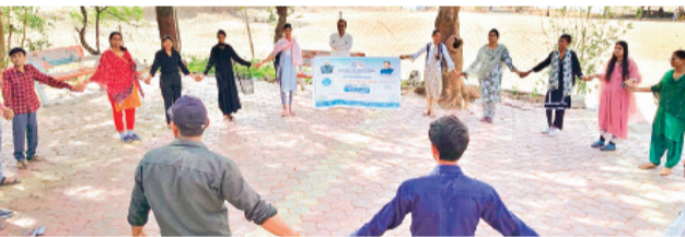
हरिभूमि न्यूज ॥ सारंगपुर