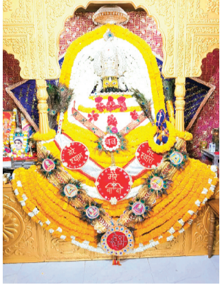
हरिभूमि न्यूज ॥ ब्यावरा

शहर के एबी रोड अरन्या पुल के पास बने श्री खाटू श्याम मंदिर में रविवार को कामदा एकादशी का पर्व श्रद्धापूर्वक