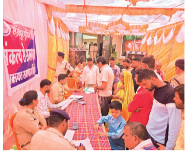
हरिभूमि न्यूज ॥ सारंगपुर